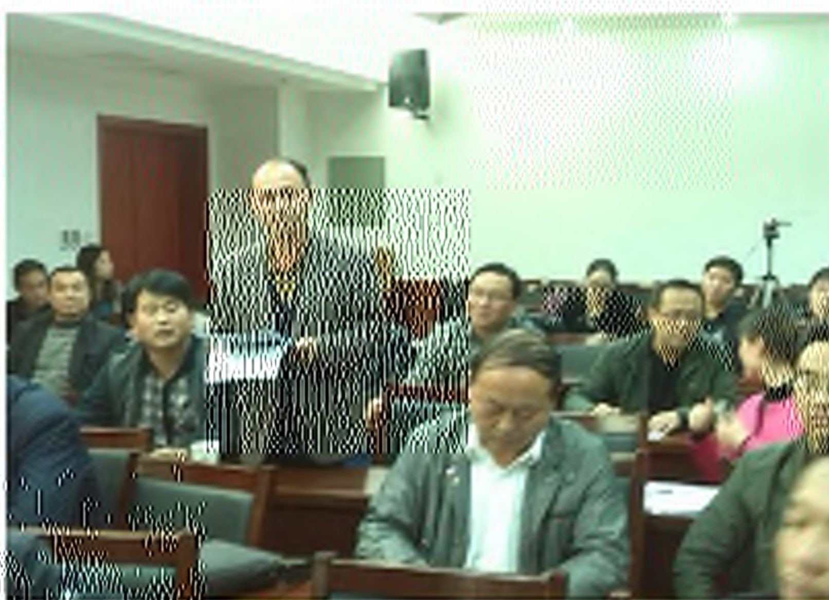
唐平校长代表第二组校长们发言